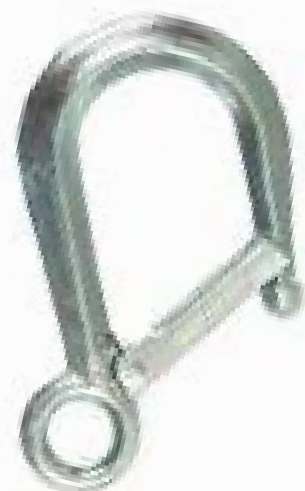
Gancho de Carretilha