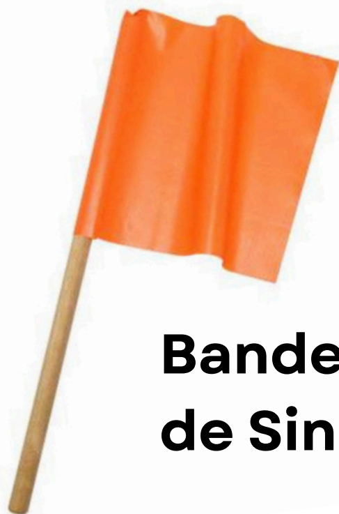
Bandeirola de Sinalização