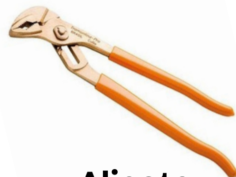
Alicate Bomba D,água