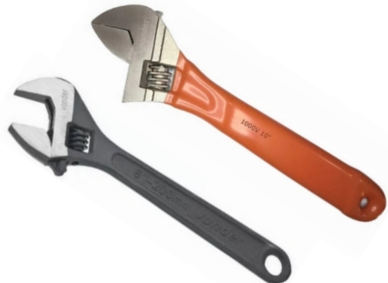
Chave Inglesa (Isolamento 1.000 volts) 8, 10 e 12 polegadas