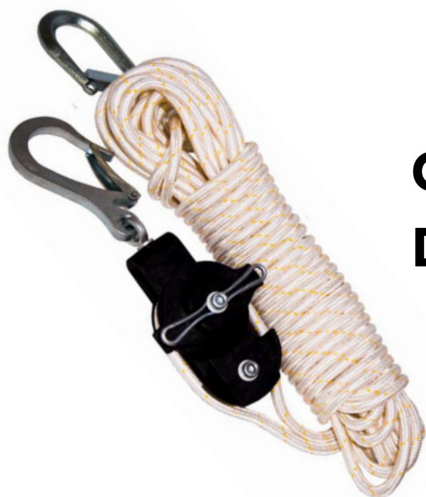
Carretilha Dupla ação