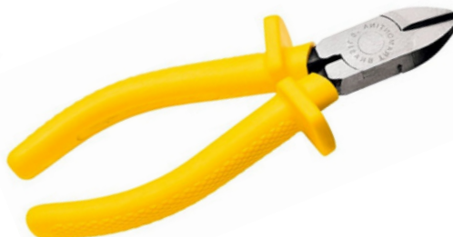
Alicate de Corte