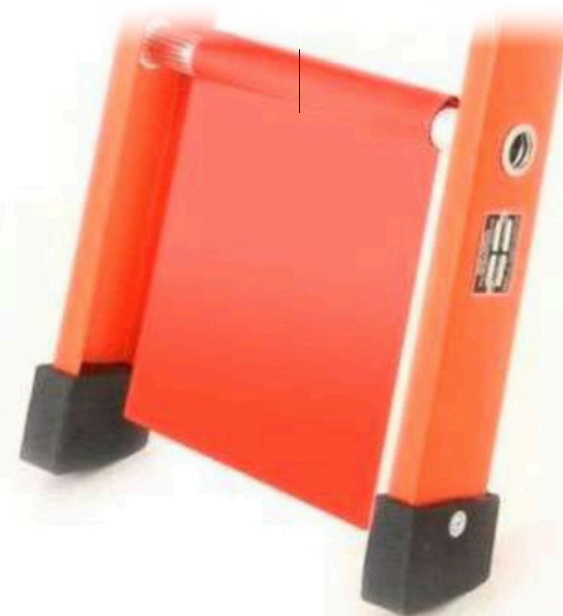
Bandeirola para Escada